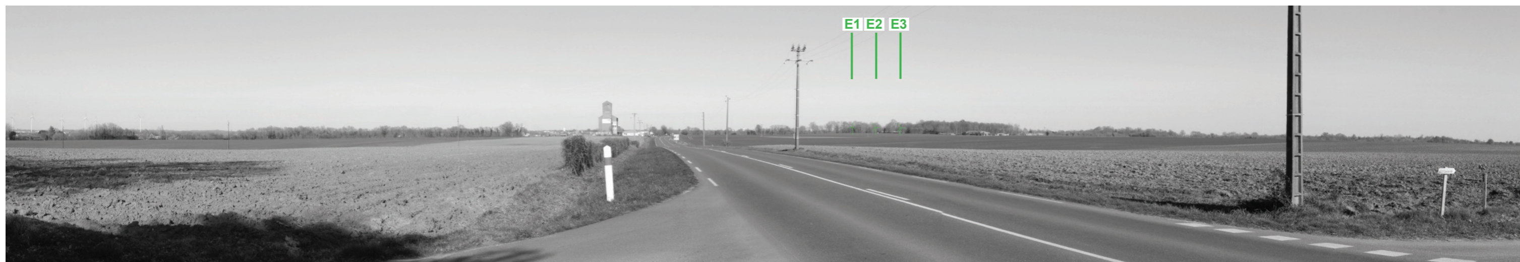
Vue panoramique noir et blanc avec esquisse du projet (angle de vue 120°)

Coordonnées Lambert II étendu : 406149 / 2135417 Date et heure de la prise de vue : 14/02/2019 à 17:02 Focale : 52 mm, équivalent 24 x 36 Azimut vue réaliste : 58° Angle visuel du parc : 3,8° Eolienne la plus proche : E1, à 9 379 m